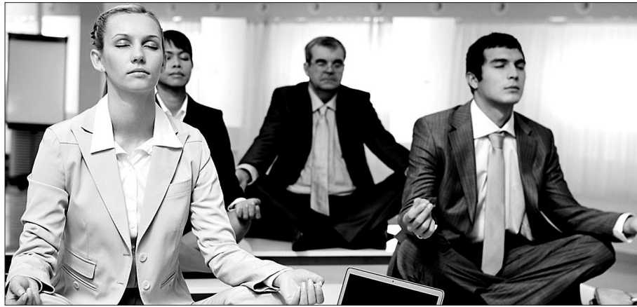
명상이 미국에서 주류 문화로 떠오르고 있지만, 부처님의 가르침인 팔정도를 뺀 세속화된 명상이 전파되고 있다는 우려를 낳고 있다.

《Huffington Post》지는 브라운 교수의 말을 인용, "세속화된 명상에 합축된 것은