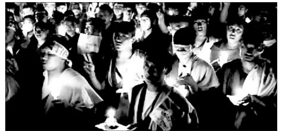
티베트 망명 정부가 있는 인도 북부 다람살라 티베트 마을 초등학교에서는 최근 매주 수요일 '하얀색 수요일(라카르)' 기도회가 열리고 있다.

티베트인들이 민족 정체성 회복 캠페인을 확대하면서 중국의 민족 동화 정책에 맞서고 있다.