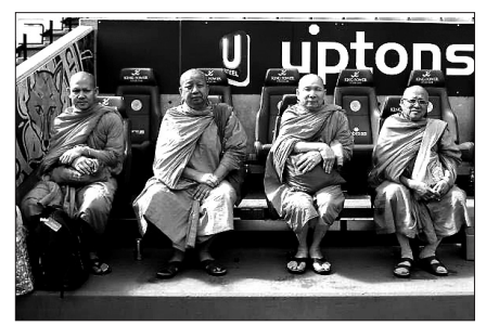
'지팡이를 휘두르는 스님들(Stick-Wielding Buddhist Monks)'은 프리미어리그에서 일약 스타로 주목받고 있다.

이후 스님들은 "지팡이를 휘두르는 스님들(Stick-Wielding Buddhist Monks)"로 프리미어리그에서 일약 스타로 주목받고 있다. 오종욱 편집위원