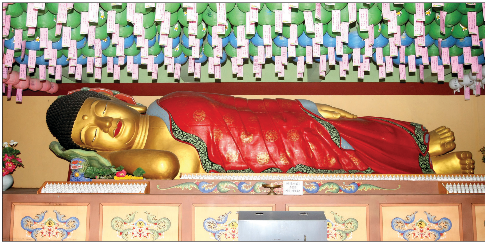
인도 스님이 보내준 인도네시아 항나무로 조성된 열반상

실학민인 창건주 해곡 스님은 1970년 우리 민족의 염원인 남북평화와 세계의 평화를 위해 호국불교의 정신으로 우리민족 응결의 산실을 마련하고