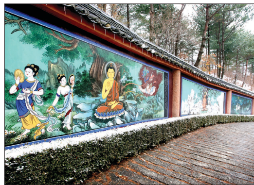
벽화로 조성된 팔상도