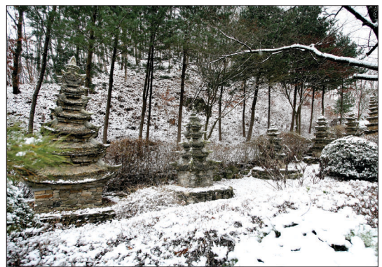
통일을 염원하는 '통일의 탑'