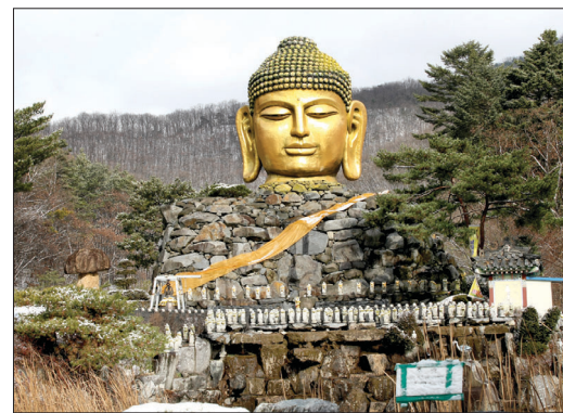
절 입구에 모신 불두상