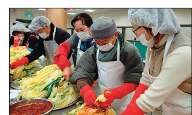
대성사는 김장 2천 포기를 소외이웃에 전달했다.

노인, 저소득 가정과 복지시설 등에 자비와 사랑의 김장김치, 연탄 나누기 등을 실시하고 있다.