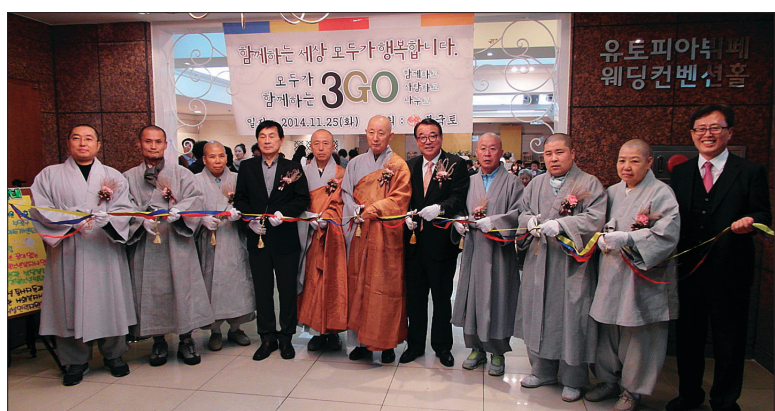
부산 불교복지의 선구자 불국토가 개설 20주년을 맞았다. 사진은 기념 자비 나눔 행사 '함께 하고 사랑하고 나누고 3GO' 행사 커팅식

을 위한 재단법인 불국토청소년 도량을 설립하며 청소년 포교를 향한 역량도 넓혀갔다. 그 결과 현재 불국토 법인이 운영하는 기관은 24개에 이르렀다. 또한 전국 최초(노인요양 시설 분야) 상락정 배산실버빌 ISO 9001인증 획득, 부산시 소재 노인 복지관 최초 ISO 9001 인증, 청소년의 달 기념 대통령 표창, 전국 청소년쉼터평가 1위 선정, 전국청소년