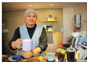
불광사가 '라오의 산들바람' 북카페를 개소했다.