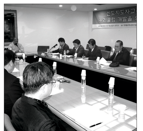
조계종 포교원은 11월 25일 한국불교역사문화기념관 2층 회의실에서 '신도지도자 교육과정 커리큘럼 개발을 위한 세미나'를 개최했다.

을 통한 사이버 교육을 실시하고 연간 2회 이상의 집체연수, 그리고 단위 사찰 스님과의 관계 속에서 이루어지는 교육이 조화를 이뤄야 한다"며 "신도지도자 교육의 필요성에 대해 중단 모든 구성원들이 인식하고 종책적 차원에서 집중지원할 필요가 있다"고 강조했다. 한편 이에 앞서 포교원 포교부장 송묵 스님은 인사말에서 "신도지도자 배출을 위한 지도자 교육에 애정과 관심이 절실한 때"라며 "이번 세미나가 중단 현실에서 시행 가능한 내용인지 함께 검토하고 고민하는 자리가 되길 바란다"고 말했다. 이나는 기자