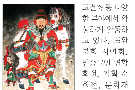
전연호 작가의 '직부사자'

한국전통문화미술협회는 전 회원이 무형문화재, 명장, 문화재 수리등록인 등으로 구성되어 전통공예 전통미술 불교미술