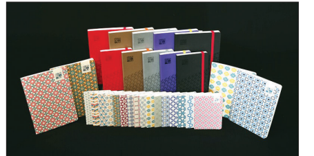
한국불교문화사업단 본디나 제품

'본디나'는 '본디 나로 돌아가다, 본연의 나를 되돌아보다'는 의미를 지닌 불교문화상품 전문브랜드로, 은은한 전통의 멋에 현대적 감수성을 더한 전통문양 수첩과 네임택, 여권 케이스, 여행용 폴딩백