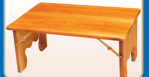
▶ 편백나무 경상