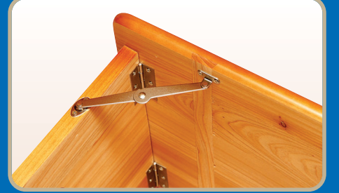
▶ 접이식 고급 경첩