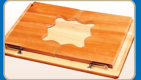
▶ 접은 상태