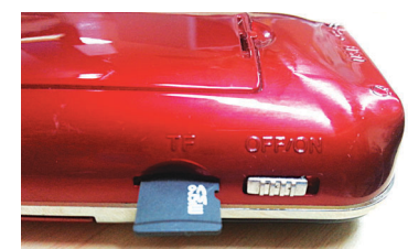
SD카드 삽입 방향

* 스님들께서 불자들에게 드리는 선물로도 더욱 좋습니다. (100개이상 구입 시 사찰명 별도 표기해 드립니다.)