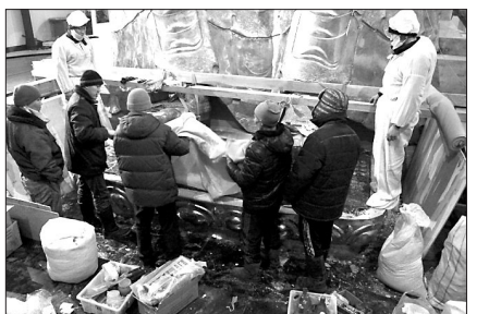
러시아의 한 스님이 세계 2차 대전을 거치며 훼손된 채 수장고에 묻혀있던 미륵불 복원에 나서 화제다.

러시아 바이칼 지역에 ‘미래 부처님’이 나타났다. 러시아의 한 스님이 세계 2차 대전을 거치며 훼손된 채 수장고에 묻혀 있던 미륵불 복원에 나서 화제다.