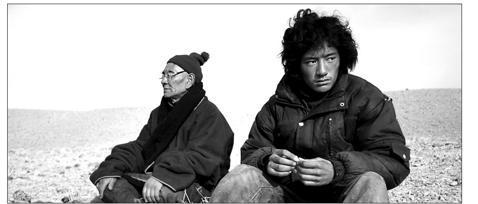
아시아 불교예술제 ‘The Inner Path’에서 우수작으로 뽑힌 티베트의 손타르 갈(Sonthar Gyal) 감독의 ‘Sun Beaten Path’의 한 장면.

아시아 불교예술제 ‘The Inner Path’가 지난 11월 24일 ‘불교영화, 예술 그리고 철학 (Buddhist Film, Art & Philosophy)’를 주제로 나흘간의 일정을 마치고 성료됐다.