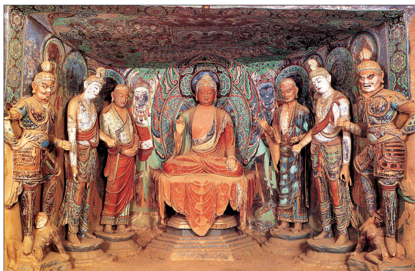
돈황 막고굴 45호굴. 뚜렷한 채색 조각들이 눈길을 끈다.