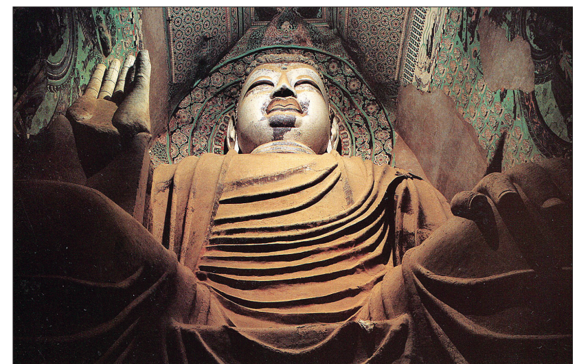
돈황 막고굴 130호굴의 미륵보살 좌상. 당나라 시기에 조성됐다.

석굴은 16호굴의 결간굴인 17호굴이다. 16호굴에 들면 오른쪽 벽면에 작은 문이 나 있다. 그 문을 들여다보면 가운데에 당나라 고승 홍변(洪辯)의 소상이 있다.