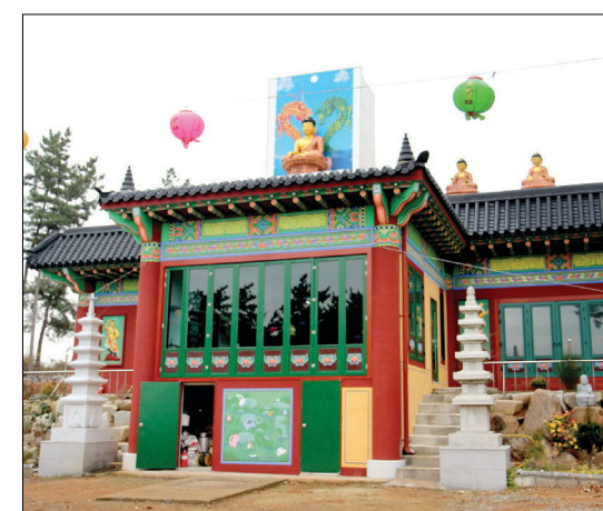
서해안의 새 관음성지로 떠오른 보타락가사 전경