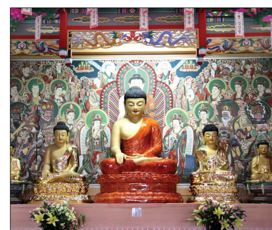
대웅전 안에 모셔진 부처님