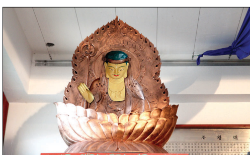
관람객 시선에따라 눈이 함께 움직이는 관음보살상