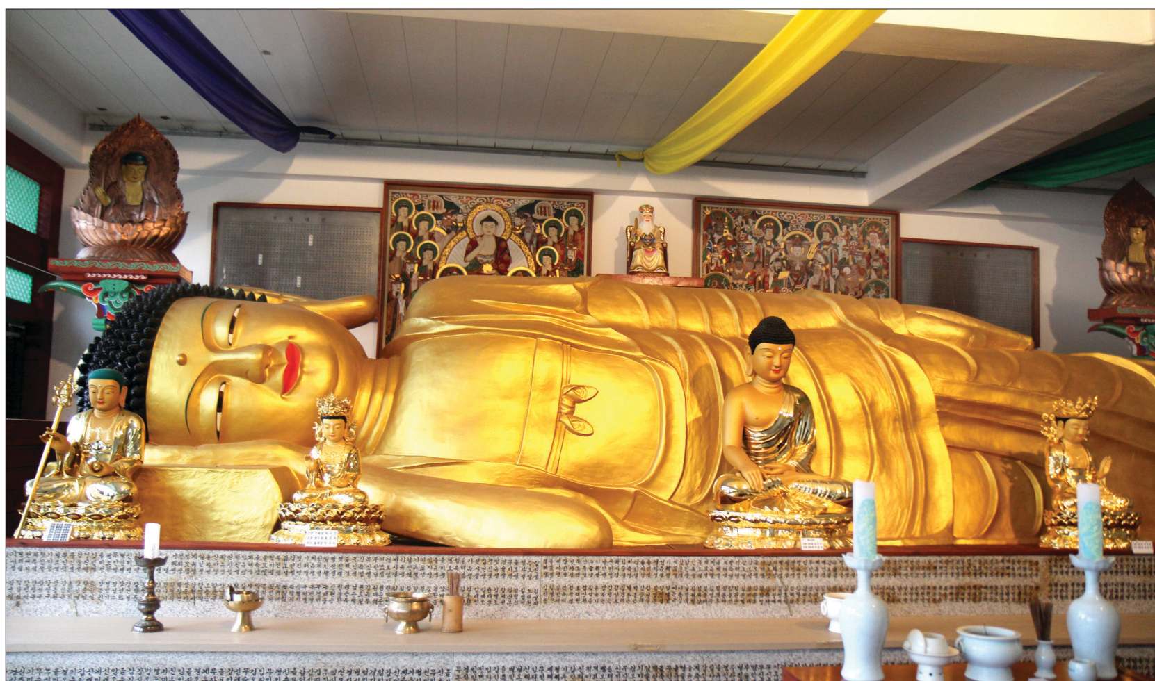
금불로 만든 길이 10m의 거대한 '열반 와불상' 부처님은 알듯 모를듯한 얇은 미소를 띄며 참배객들에게 편안함을 전해준다.