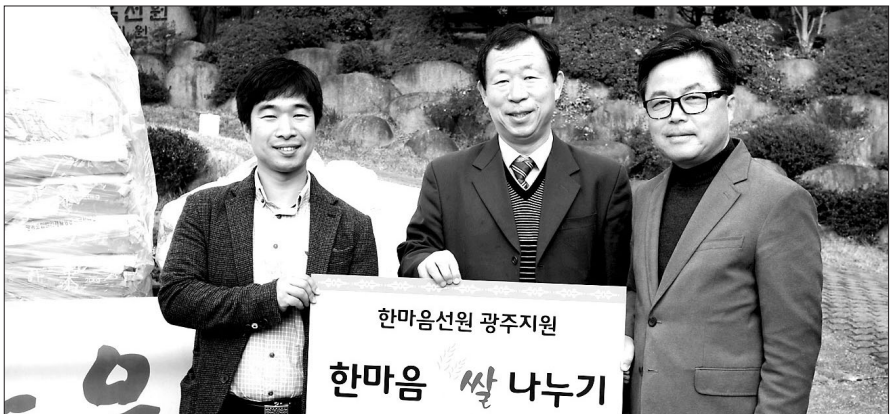
한마음선원 광주지원은 11월 27일 쌀 2000kg를 빛고을나눔나무에 전달했다.

광주지역 불교공동모금회인 빛고을나눔나무(광주불교연합회 부설기관, 이사장 연광)가 지역 사찰들의 자비나눔행렬이 이어지고 있다.