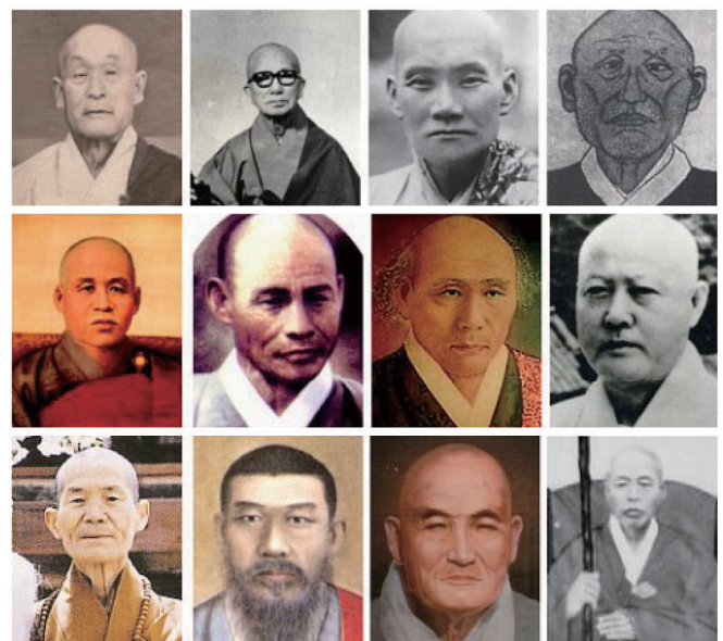
(맨윗줄 왼쪽부터) 효봉 해암 한암 학명 스님, (둘째줄) 용성 만해 민공 동산 스님, (셋째줄) 교암 경허 경봉 만암 스님, 모두가 근현대 한국불교를 폄이했던 선지사들이다.

염화시종의 미소만 미소라. 한국 근·현대의 불교를 이끌었던 선지식도 중생제도를 위해 한 없는 자비의 웃음을 날렸다. 그러한 웃음을 선가(禪家)에서는 ‘황금털사자(金毛獅子)의 미소’라고 일컫는다. ‘황금털사자’란 존재의 모습을 표현하는 인간의 한계를 드러낸 뜻이라. 선사들은 삶 속에서는 물론, 법문에서, 제자 사랑에서 그 미소를 강물처럼 쏟아냈다. 이것이 노래로 우리 나오니 바로 선시(禪詩)가 됐다.