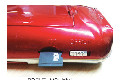
SD카드 삽입 방향

* 스님들께서 불자들에게 드리는 선물로도 더욱 좋습니다. (100개이상 구입 시 사찰명 별도 표기해 드립니다.)