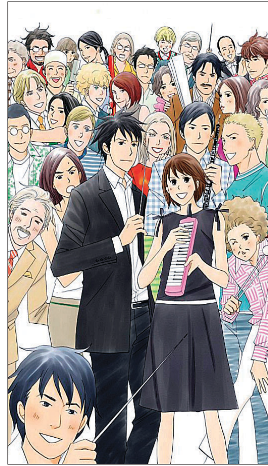
<노다메 칸타빌레>의 포스터. 다양한 캐릭터의 조화가 오케스트라처럼 펼쳐지는 것이 이 작품의 가장 큰 매력이다.

트라를 교향악단(symphony orchestra)이라 부르고, 교향악단은 교향곡(심포니)을 전문으로 연주하는 단체이다. 교향곡(심포니)의 어원은 'sym=함께, phonia=울림'에 있다.