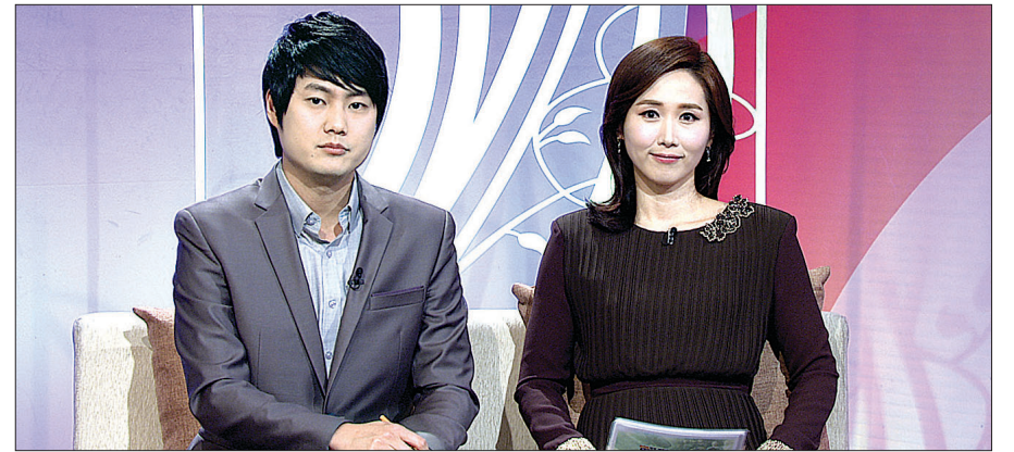
BTN생방송 '보시' (연출 류건욱·박동건PD)는 2013년 첫방송 이후 100회를 맞았다.

BTN생방송 '보시' (연출 류건욱·박동건PD)가 11월 26일 100회를 맞아 특집 생방송을 진행했다. 불교사회복지 활동 소개, 기부문화 대중화, 재능보시활동 가능성 발견 등을 위해 기획된 프로젝트 프로그램 '보시'는 2013년 1월 2일 첫 방송 이후부터 매주 오후 2시 생방송으로 시청자들을 찾아왔다.