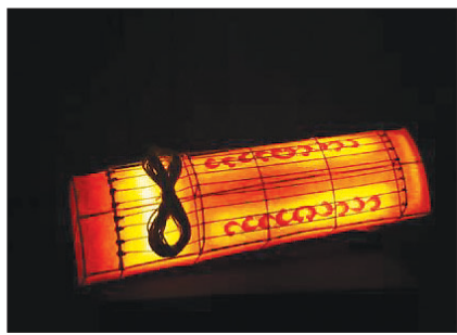
부처님을 찬탄하는 악기등

연등회(종교무형문화재 제122호)는 11월 25일~12월 4일 한국불교역사문화기념관 1층에서 '빛으로 통하다-연등회장엄전'을 연다.