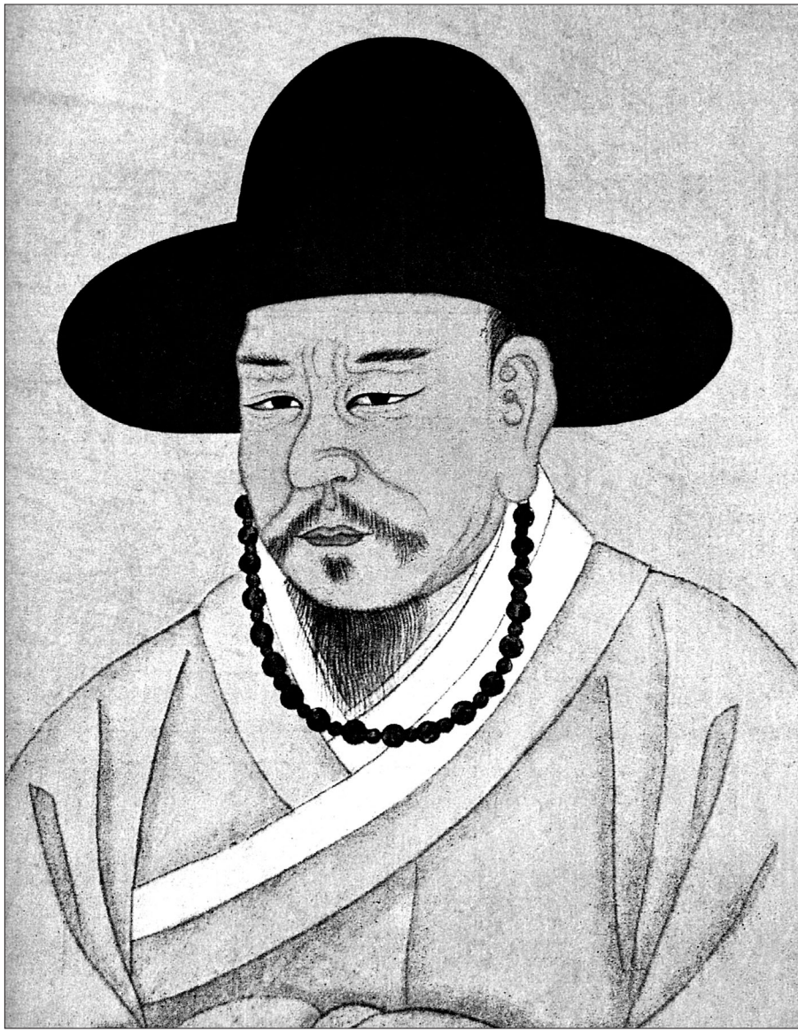
매월당 김시습(1435 ~ 1493)의 전영. 그는 31세인 1465년 봄에 경주로 내려가 남산에 금오산실(金鰲山室)을 짓고 칩거했다. 이곳에서 우리나라 최초의 한문소설로 불리는 <금오신화>를 창작했다.

우선 <만복사저포기>를 보자. 양생(梁生)은 일찍 부모를 잃고 결혼도 못한 채 만복사 동쪽에서 외롭게 살고 있었는데, 고독한