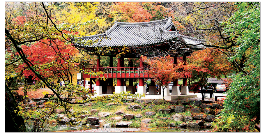
백암사 주변경치와 어울려 기묘한 풍광을 자아내는 쌍계루. 단풍에 물든 모습이 아름답다.