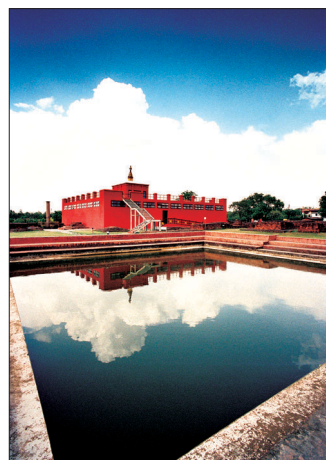
부처님 탄생지 룬비니