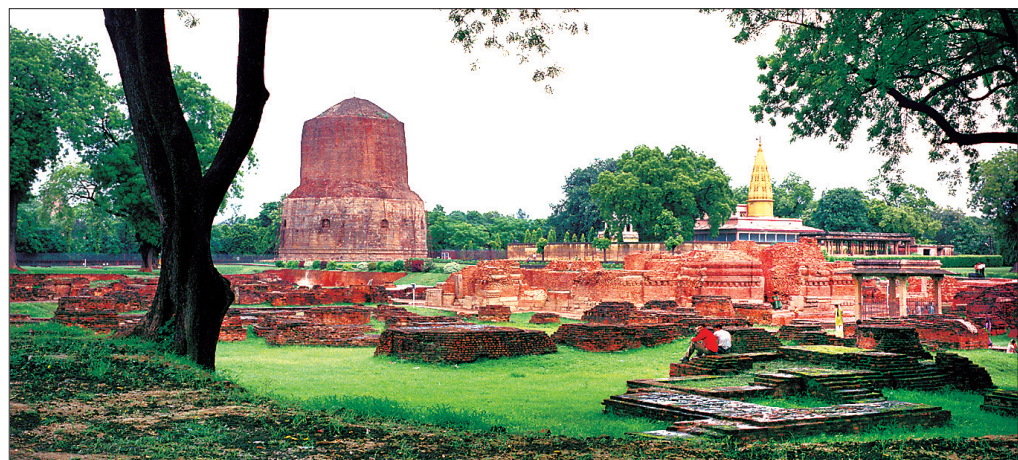
초전법륜지 사르나트, 나무 사이로 올라오는 폴처럼 불빛이 잘 전파되길 바라는 마음을 담았다.