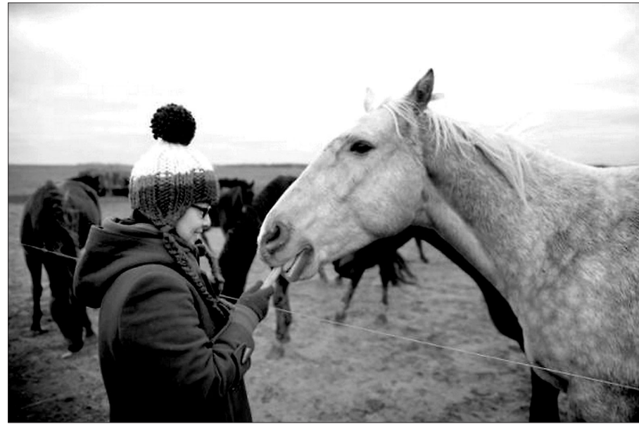
캐나다 킹스 카운티에 있는 버팔로랜드 공원에는 들소, 말, 라마 등을 방목하고 있다.