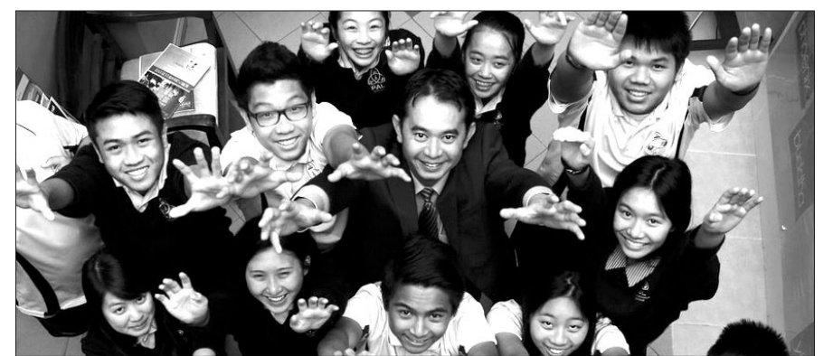
호주에 처음 문을 연 불교 고등학교인 'Pal School'의 학생들.