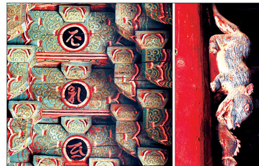
사방포벽 위 장엄된 범자와 범당기둥을 타고 내려오는 수달형상.

락보전 천정에서 호리字와 육자대명왕진언이 나타나는 바, 그 범자종자불은 아미타불과 협시불인 관세음보살에 각각 상응해서 불전-불상-후불벽화-천정장엄이 일관된 체계를 이루고 있는 것이다.