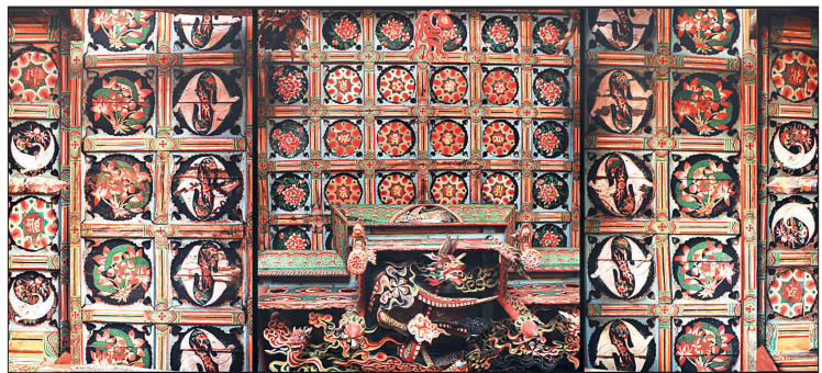
극락보전 천정장엄과 답집.