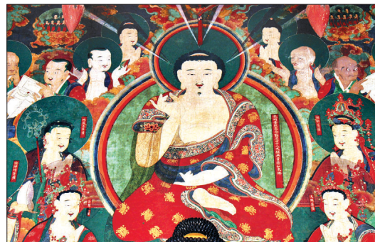
아미타후불탱의 대표적인 명작 천은사 아미타후불탱 부분