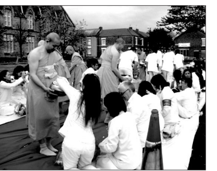
영국 쉐번 강변에서 태국과 스코틀랜드 및 영국 등 전역에서 온 300여 명이 안겨를 마친 스님들에게 가사를 보시하는 의식이 거행됐다.

까티나 행사는 테라와다불교 전통에서 우기 3개월간 안겨가 끝나는 시점부터 벌어지는 행사다. 이때 재가불자들은 비구 스님들에게 가사 등 필수품을 보시한다. 까티나 행사는 태국, 미얀마, 스리랑카 등