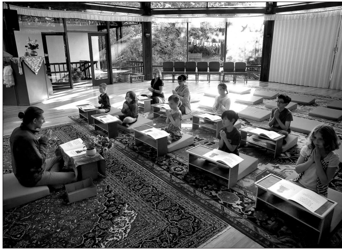
사라어린이학교 학생들은 수업에서 '지혜' '자비' '평화'를 주제로 한 교육을 받는다.