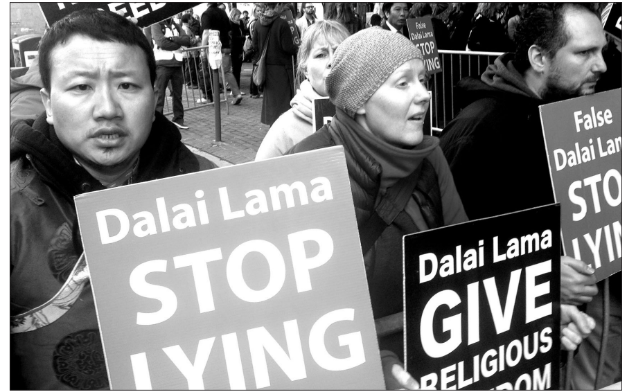
달라이라마를 환영하는 인파와 반대하는 수백 명의 시위대가 대치하는 상황이 뉴욕 한복판에서 벌어졌다.