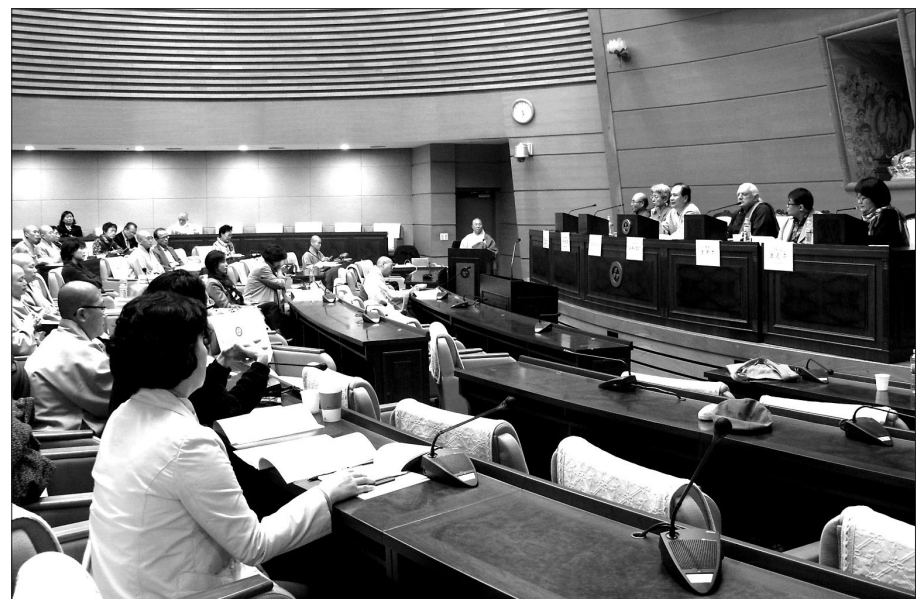
대한불교조계종 불교상담개발원(원장 도현)은 10월 30일 한국불교역사문화기념관에서 ‘불교의 깨달음, 심리치료의 통찰’을 주제로 10월 정기세미나를 개최했다.