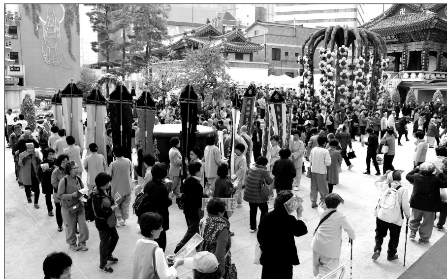
서울 조계사는 11월 14일까지 승려노후복지기금을 마련을 위한 생전예수재를 거행하고 있다.

사후의 극락왕생을 기원하는 것으로 알려진 ‘생전예수재’는 자신의 죽음을 내다