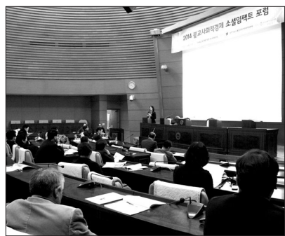
사단법인 날마다좋은날 불교사회적경제지원본부는 10월 28일 한국불교역사문화기념관 국제회의장에서 ‘2014 불교사회적경제 소셜 임팩트 포럼-불교사회적경제, 기업 사회공헌전략과 통하다’를 개최했다.

이어 도 대표는 대기업과 사회적기업이 파트너십을 형성해 성공한 해외 사례