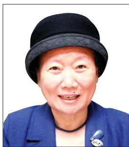
“스님·포교사만 포교사 아니다” “주변에 가르침 실천도 큰 수행”