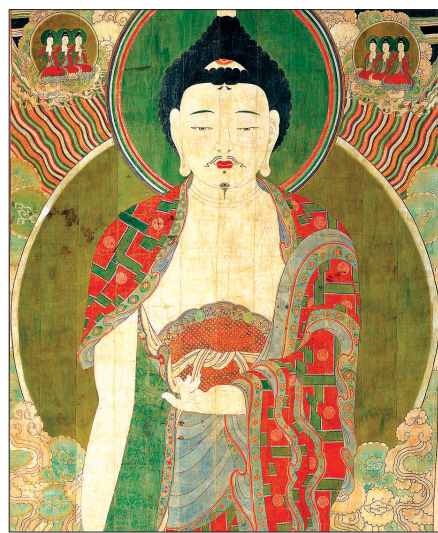
해남 미황사 괘불 모사도(부분)

사찰문화재연구소 이수예 소장(42)은 ‘명필 미황사 큰부처님 서울에 나투시다’전을 기획한 장본인이다. 불화가인 그는 이번 전시에서 사찰문화재연구소 연구원들과 함께 높이 약 1170cm, 폭 486cm에 달하는 초대형 걸개그림인 ‘해남 미황사 괘불(보물 1342호)’을 완성해 대중에게 공개했다. 이번 전시가 아니라, 미황사의 천불도 25점, 포백나한도 13점, 단청만양도 114점 등 총 153여 점을 모사해 11월 4일까지 인사동 아라아트센터서 전시를 열었다.