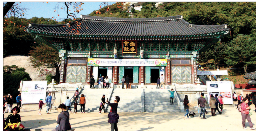
우리나라 3대관음도량의 하나로 늘 기도객과관광객이 끊이지 않는 보문사.

스님의 시답게 차분하다. 만행을 하다가 들른 보문사의 풍경이 ‘10년의 정’으로 다가오는데, 푸른 수풀과 바다 안개가 조화를 이루고 멀리 빛으로 보이는 여선과 누각의 사람 말소리는 고요 속에 잠기고 있다. 그러한 고요 속이란 다음 아년 선정의 삼매일 것이다. 구도자에게 그러한 삼매야말로 최고의 즐거움이다. 그래서 시를 차운하며 물결소리 듣는 한가한 경지의 사람, 무위진인이 되고 싶은 것이 아니겠는가?