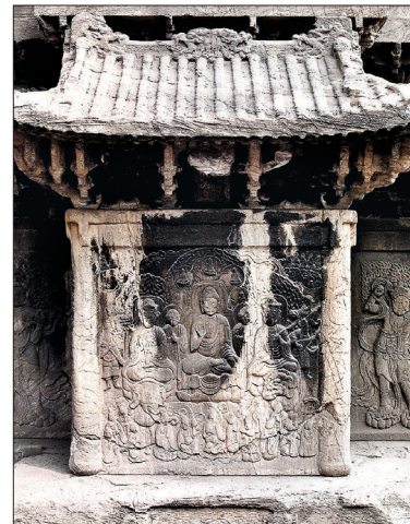
분진과 유리보호각 내 온도변화로 화학적 훼손이 일어난 원각사지 10층석탑의 일부 모습

존상태는 양호하다'고 된 부분이다. 국보 59호 법천사지 지광국사탑비도 귀부와 이수 일부가 조류와 지의류에 의해 피복돼 있는 것으로 나타났다. 경복궁에 있는 국보 제101호 법천사지 지광국사탑도 마찬가지였다. 현재 지대석과 하대석의 연결부분은 결구가 어긋나 석재 일부가 돌출된 상태로 이격 및 침하현상이 발