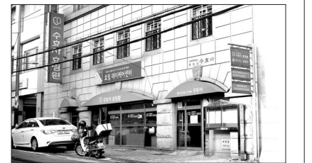
서울시 서대문구에 위치한 수효사 효림원