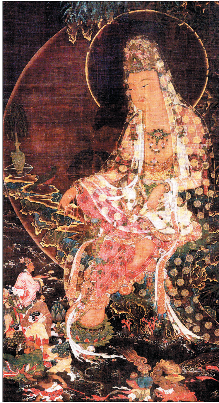
무로마치시대 아시카가 쇼군이 소장했던 수월관음도. 최근 일본에서 열린 전시회에서 공개됐다.