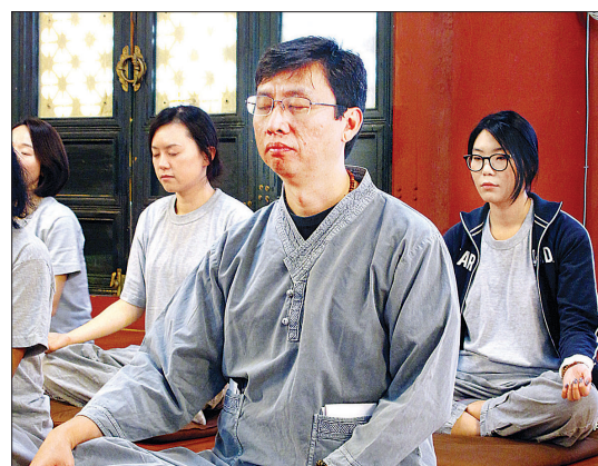
차드 멧탄은 사마타와 위빠사나, 자비관 등 남방불교 수행법을 바탕으로 한 마음챙김 명상을 전세계에 전파하고 있다.

차드 멧탄은 템플스테이에 이어 15일 한국불교역사문화기념관 국제회의장에서 열린 세미나에도 참