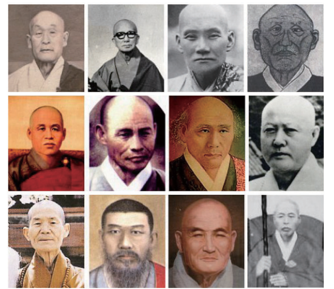
(맨윗줄 왼쪽부터) 효봉 해암 한암 학명 스님, (둘째줄) 용성 만해 민공 동산 스님, (셋째줄) 교암 경허 경봉 만암 스님. 모두가 근현대 한국불교를 꽃피웠던 선지사들이다.

염화시종의 미소만 미소라. 한국 근·현대의 불교를 이끌었던 선지식도 중생제도를 위해 한 없는 자비의 웃음을 날렸다. 그러한 웃음을 선가(禪家)에서는 ‘황금털사자(金毛獅子)의 미소’라고 일컫는다. ‘황금털사자’란 존재의 모습을 표현하는 인간의 한계를 드러낸 것이라. 선사들은 삶 속에서는 물론, 법문에서, 제자 사랑에서 그 미소를 강물처럼 쏟아냈다. 이것이 노래로 우리 나오니 바로 선시(禪詩)가 됐다.