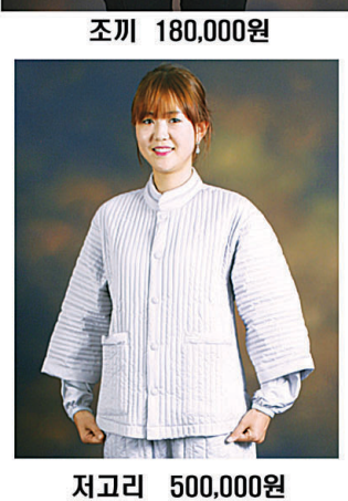
저고리 500,000원 450,000원 350,000원