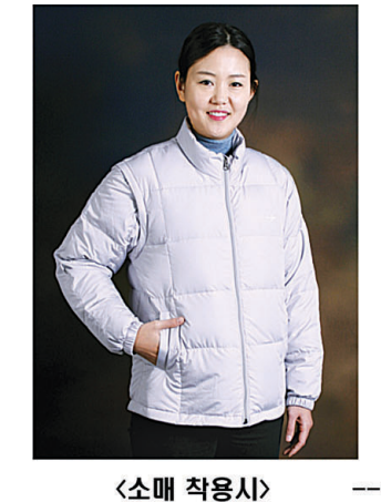
<소매 착용시> 거위털 점퍼 (지퍼 타입) 320,000원