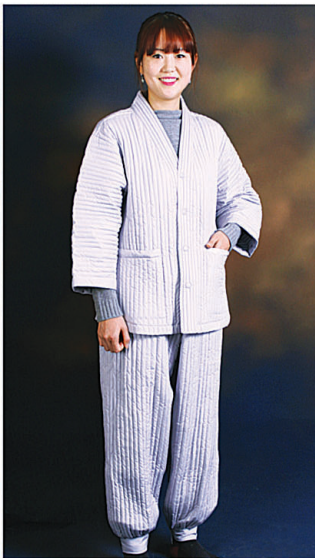
누비 적삼 55만,50만,45만원 누비 바지 55만,50만원