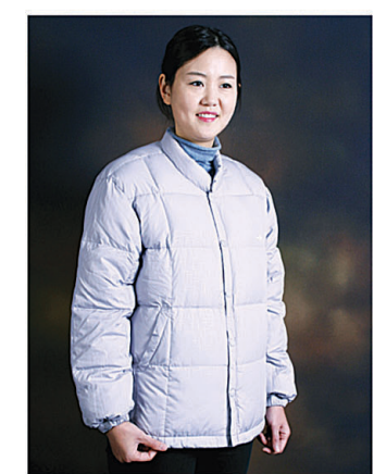
후드점퍼 410,000원 480,000원