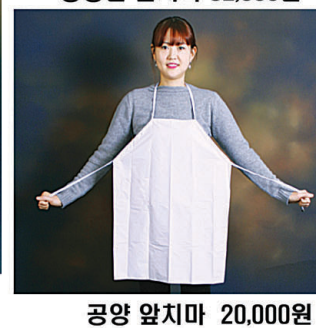
공양 앞치마 20,000원