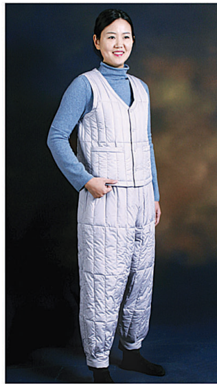
속조끼 230,000원(녹차) 148,000원(일반) 속바지 380,000원