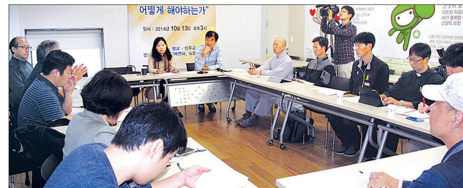
조계종 노동위원회는 10월 13일 템플스테이정보관에서 천주교 서울대교구 노동위원회, 기독교 인권위원회, 민주화를 위한 전국교수협의회, 민주사회를 위한 변호사, 참여연대 등과 함께 노동자 연대를 모색하는 세미나를 열었다.

“성우상사 거위털 제품의 특징은 가볍고 따뜻하며 땀이 차지않습니다.(거위털이불,패드,베개) 강력한 흡습, 발산, 공기중 형성으로 체온을 33° ±1 유지하고 숙면을 도우며 우리의 몸의 면역력을 증강시킵니다.”