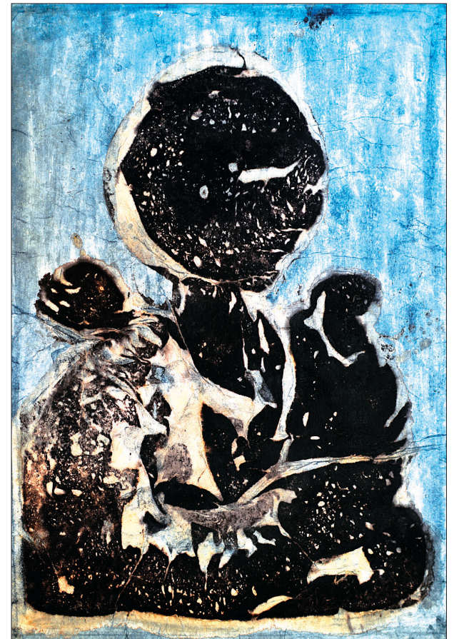
무한한 자비의 의미를 담아낸 '자비무량불'