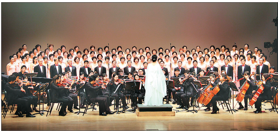
제4회 통일음악제 10월 25일 부산 KBS홀에서 열린다. 사진은 지난해 음악회 장면.

제4회 불교총지중 통일 음악 예술제가 10월 25일 오후 2시 부산 KBS홀에서 열린다. '마음의 평화를 통한 화합 그리고 통일'이라는 주제로 열리는 이번 예술제는 남북 화합은 물론 다문화 가정, 새터민, 부산 시민 모두가 부처님의 법음으로 하나 되기를 서원하는 예술제다.