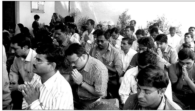
유바 불교 그룹(Yuva Buddhist Group, 이하 YBG) 회원들은 하이데라바드 시의 주요 사원에서 매주 법회를 봉행하고 있다. 사진은 YBG 회원들이 제타반 붓다 비하르(Jetavan Buddha Vihara)에서 법회를 봉행하는 모습.