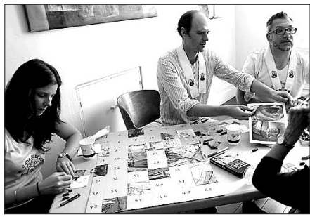
지난 8일 봉행된 시드니 불교센터 '개축 기념 법회'를 준비했던 자원봉사자들.