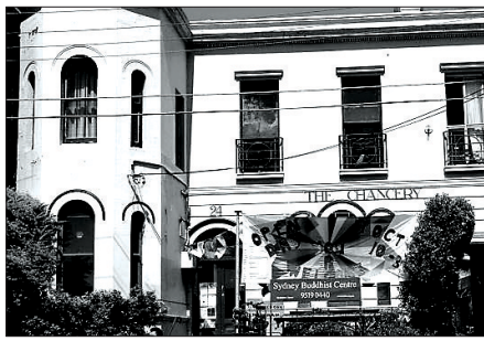
개원 10년 만에 새롭게 단장한 '시드니 불교센터' 전경.

붓다 블리츠 캠페인은 클라우드 펀딩 전문회사인 '스타트썸굿(Startsomegood)'의 사이트에서 시드니 불교센터의 목적, 현황, 활동 등을 소개하고 리모델링 비용을 모금하는 것으로 진행됐다. 이와 함께 불교센터 재적 법우들의 노력봉사도 캠페인 진