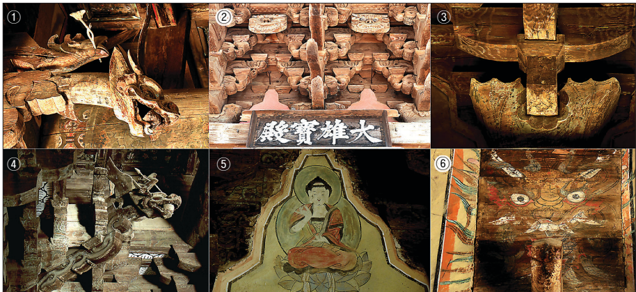
①어간의 용과 봉황 ②대웅보전 편액과 용의 정면얼굴 ③정면공포의 연잎 하엽문 주두 ④향우측 귀공포의 용과 봉황 ⑤포벽에 배운 여래불 벽화 ⑥향좌측 포벽의 용면변화