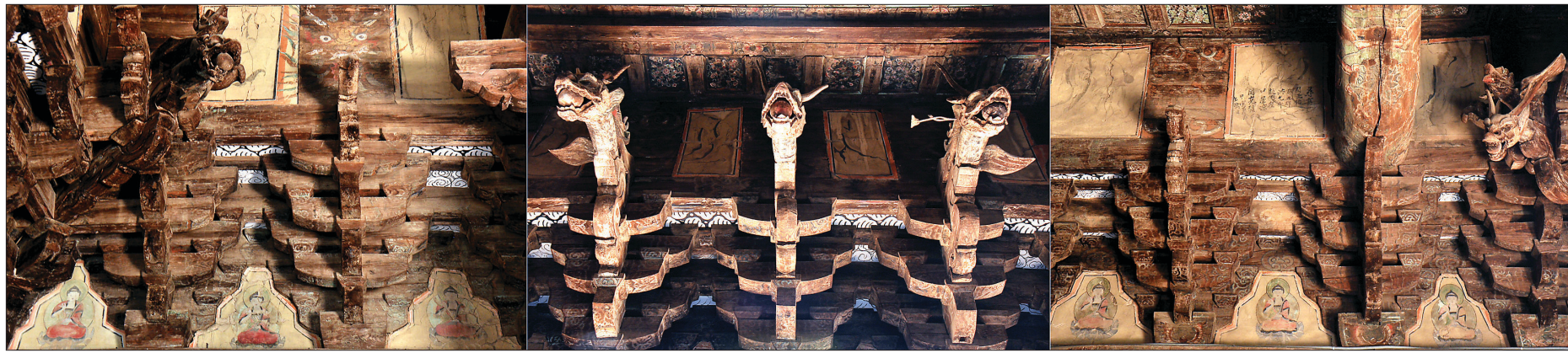
좌에서부터 차례로 대웅보전 내부포벽의 뒤, 정면, 측면에 두루 경영한 조형세계다.