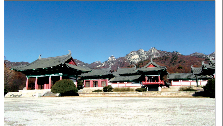
조선조 이후 퇴락했던 개성 영통사는 2005년 천태종에 의해 복원되었다.