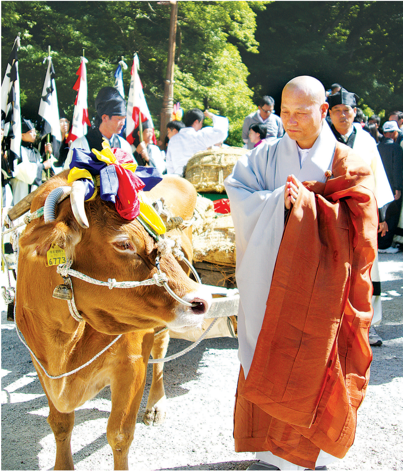
... 1,500+ ...