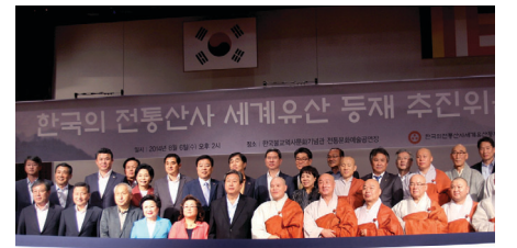
올해 8월 6일 열린 전통산사 세계유산 등재 추진 위원회 발족 모습.

가 요원과 거점이 될 수 있는 사찰이 운영될 때 해외 포교가 제대로 운영될 수 있음을 알게 한다.