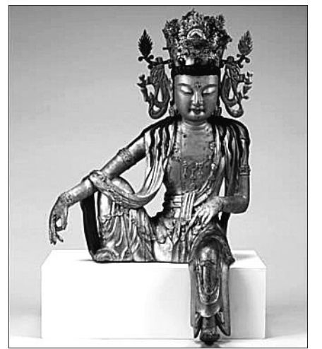
고려불상으로 밝혀진 '덕수953' 불상

박물관은 “이왕기박물관이 소장하다 이관된 불상을 정밀하게 조사했더니 양식이 나 제작 기법, 머리와 몸체에서 발견된 복장물, 탄소 연대 측정 결과 등을 종합할 때 고려 13세기 불상임을 확인했다”고 밝혔다. 고려 목조불상은 안동 봉정사 목조관음보살좌상 등 10점 정도만이 남아있다. 이 불상은 오른쪽 다리를 굽혀 세우고