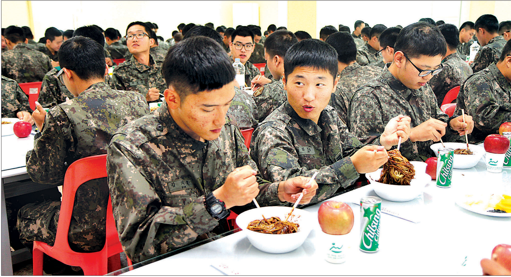
6포병여단 장병들이 조계종 군종교구가 국군의날을 맞아 마련한 자장면 공양에서 즐겁게 자장면을 먹고 있다.