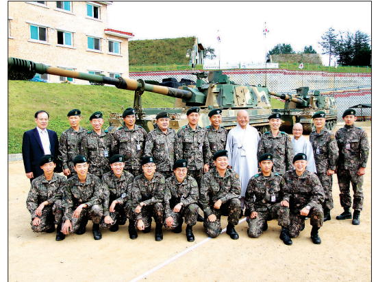
K9 자주포 견학 후 여단 관계자들과의 기념사진