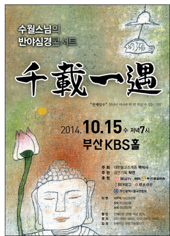
천재일우 공연 포스터

추가후 30년 만에 음반 발매 찬불가 판소리 뮤지컬 등 다양한 장르 공연 무대에 올라 10월 15일 부산 KBS홀서 공연