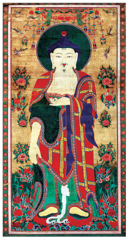
영천 은해사 괘불명화

권속을 대동하지 않고 본존 여래만을 단독으로 등장하는 단순한 형태로 이러한 불화는 대개 영산회상의 석가모니불로 인식되어 18세기에 유행했던 형식이다. '은해사 괘불명화'는 주존의 구성과 배치, 상하의 습문양, 연꽃 위에 두 발로 서있는 장면 등은 같은 해에 제작된 '은해사 대웅전 아미타후불명화(1750)'와 동일한 양식이다. 은해사 괘불명화는 여기에 주존 아미타불만을 분리하여 독존상으로 도해한 것으로 보인다. 따라서 은해사 괘불명화는 기존의 영산회를 위한 괘불의 성격을 유지하면서 정토왕생과 보다 밀접한 아미타불로 조성되었을 가능성이 높다. (055)382-1001 정혜숙 기자