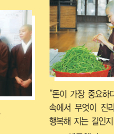
"돈이 가장 중요하다고 말하는 젊은이들 속에서 무엇이 진리이고 무엇이 정말로 행복해 주는 것인지 알고 싶었습니다." - 해주행자 (이화여대 동덕여자대학교원 한영문과 졸업)