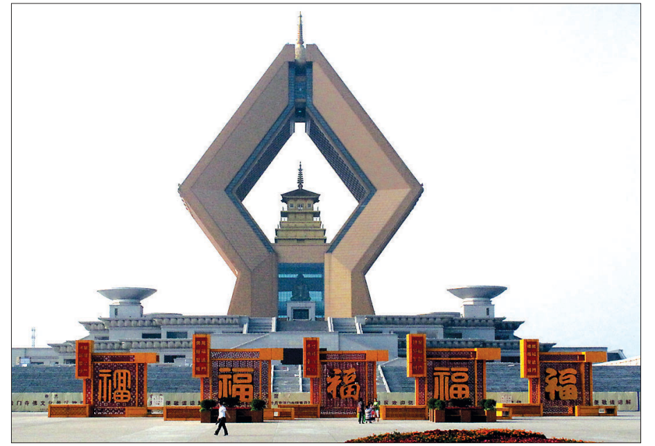
새롭게 만들어진 법문사의 보궁. 멀리서도 그 위용이 대단하다.

현대에서도 진신사리를 봉송해 친견하게 하는 교류가 활발하게 이뤄지듯 최고 전성기 시절 법문사 사리공양에 구법승들의 참여는 없었을까? 이를 증명하는 기록은