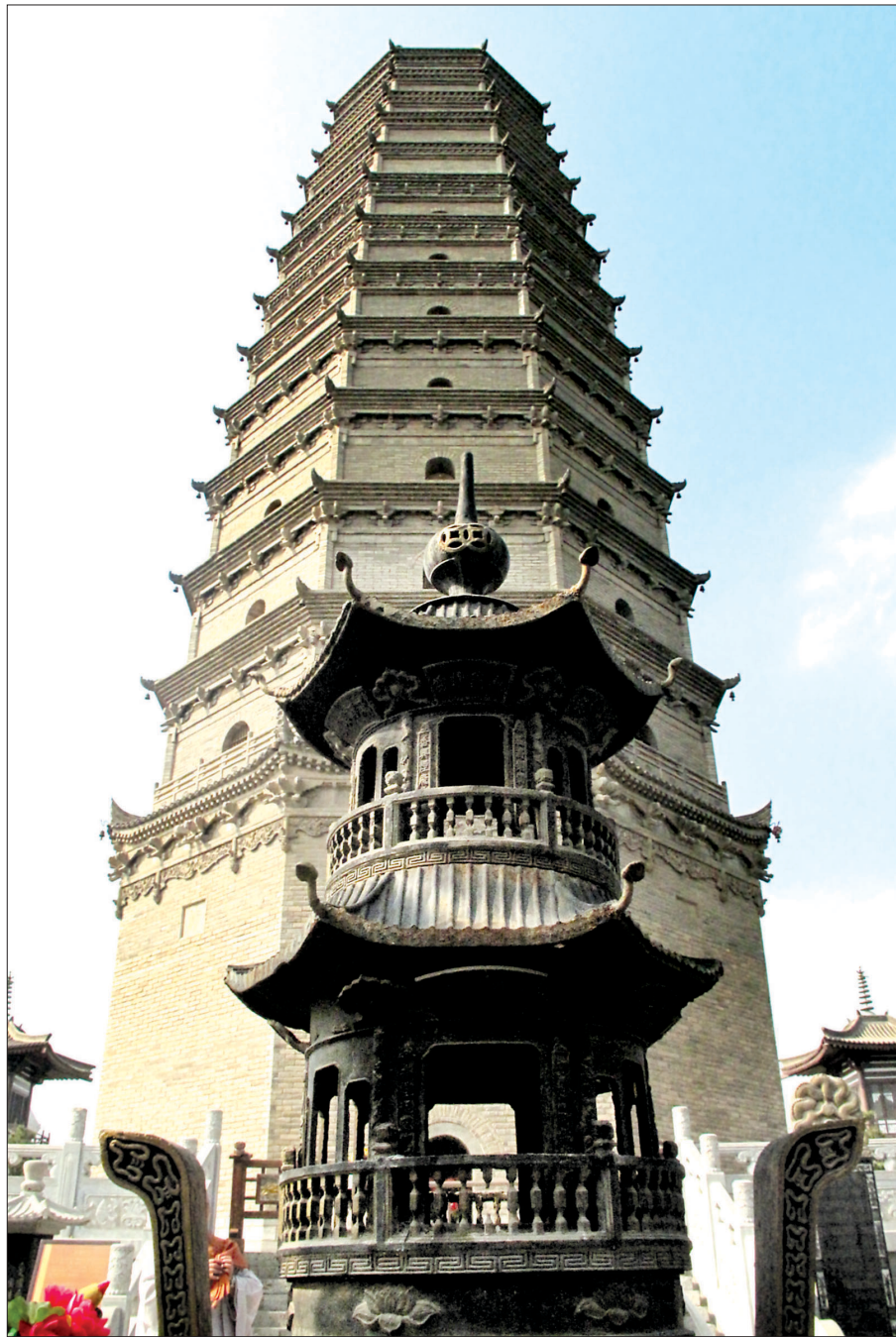
1. 법문사 진신사리탑. 1986년 반파된 탑을 해체 보수하던 중 탑 아래에서 지하궁이 발굴됐으며, 이 안에서 지골사리 4과 등 국보급 문화재 300여 점이 나왔다.

영육의 세월을 견뎌온 법문사를 현재의 대찰로 발전시킬 수 있던 것은 바로 부처님 지골사리 때문이다. 최고 전성기 시절 법문사의 사리공양은 유명했다. 북위부터 당에 이르기까지 황제의 부처님 지골사리의 영골은 9개기 이뤄졌으며, 그 중 7차례가 당나라 시기 법문사에서 봉행됐다. 그만큼 지골사리 참배는 일반인들에게는 일생에 한번