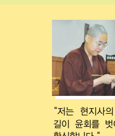
"저는 현지사의 스님이 되는 길이 윤회를 벗어나는 길임을 확신했습니다." - 원오행자 (고려대 영문과 졸업)