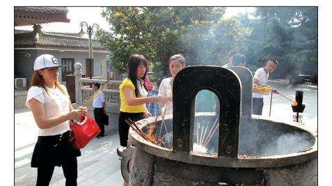
법문사 일주문 앞 향로에서 향공양을 하고 있는 중국불자들.