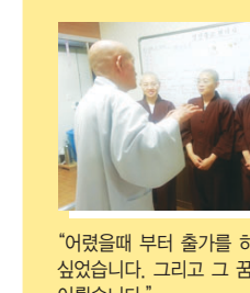
"어렸을 때부터 출가를 하고 싶었습니다. 그리고 그 꿈을 이뤘습니다." - 자성행자 (고려대 정치외교학과 졸업)