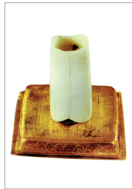
부처님 지골사리. 당나라 시기에 가장 많은 공양이 이뤄졌다.