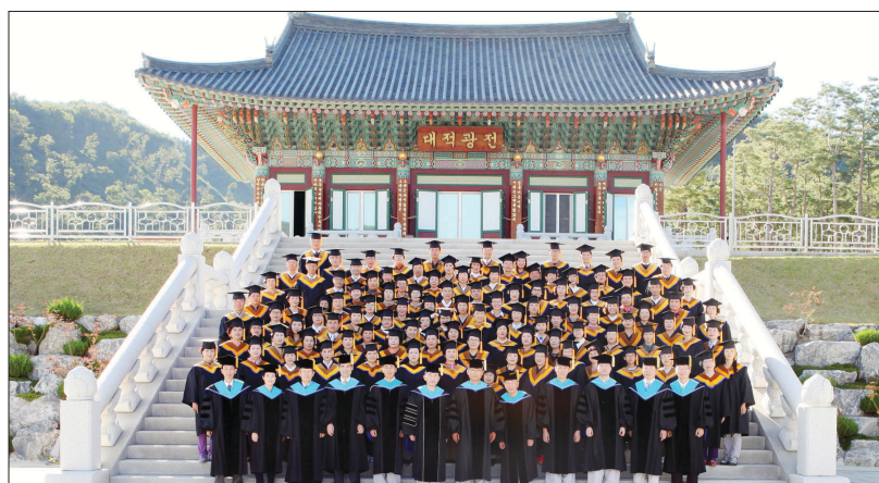
2013년 4학년 졸업식

지금의 세계불교는 부처님의 '무아론(無我論)'을 잘못 해석하여 인간본체인 영혼체의 존재도 나