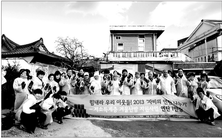
지난 2013년 12월 광주불교연합회가 지역 불교단체인 자비신행회와 공동으로 자비의 연탄나눔기 사업을 진행하는 모습

또한 광주지역 사찰에서 불교단체를 설립할 수 있도록 유도한다. 1개 사찰 1개 단체를 목표로 사업이 진행된다. 설립준비위는 창립취지문을 통해 "그동안 잠재되었던 광주 30만 불자들의 힘을 하나씩 발굴하고, 이를 엮어 다양한 불교시민단체가 육성되기를 위한 첫 사업을 시작한다"고 말했다. 이어 "빛고를 나눔나무는 광주불교를 활성화하기 위한 불사(佛事)"