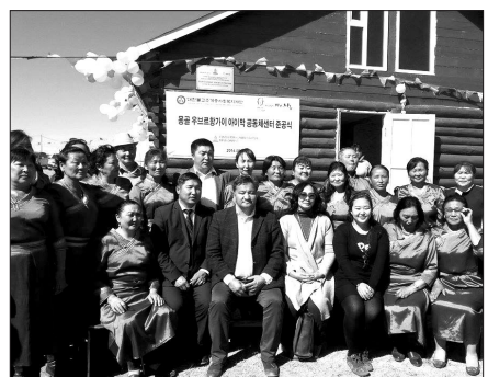
조계종사회복지재단이 준공한 몽골지역 주민 공동체센터.

조계종사회복지재단(대표이사 자승)은 지난 9월 16일 몽골 수도 울란바토르에서 차로 9시간 떨어진 몽골 중부지역 우브르항가이 아이막 아브바이헤르 지역에 공동체센터를 준공했다. 이번엔 지어진 우브르항가이 아이막 공동체센터는 주민들을 위한 마을회관 및 공동작업장 역할을 하게 된다. 한국의 '두