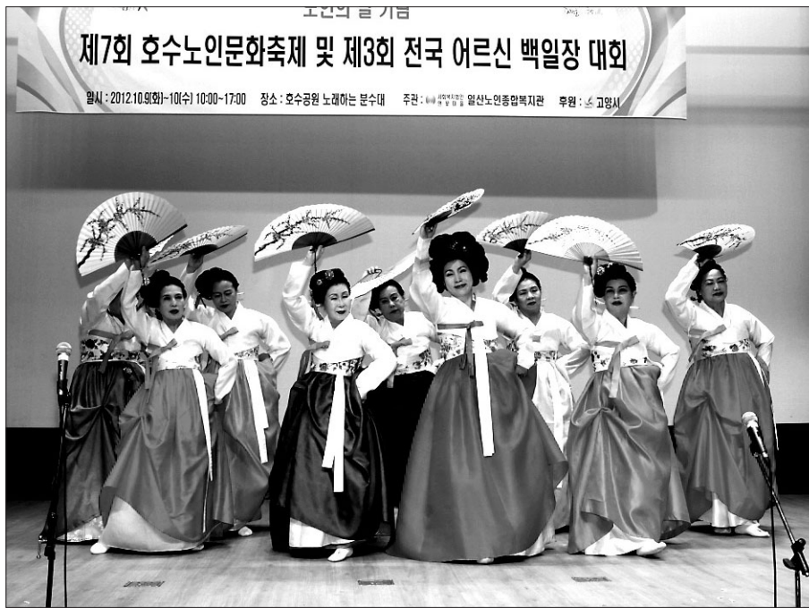
지나해 10월 일산 호수노인문화축제에 참여한 어르신들이 그동안 갖고 닦은 기량을 뽐내고 있다.

비된다. 노인생애체형은 시력이 감퇴하고 청력이 떨어지는 등 노인이 되면 겪게 되는 신체 기능의 저하를 도구를 통해 미리 체험해봄으로써 노인인 대한 이해폭을 넓힐 수 있다. 행사기간에는 건강검진, 교양강좌, 나눔장터 등이 이어진다. 복지관 내 1층 로비에서는 국화화분을 나눠줄 예정이며 10월 14일에는 골밀도, 우울증, 정력, 구강, 손청결 등 5대질환에 대해 무료건강검진이 실시된다. 이어 10월 16일에는 오전 10시부터 복지관 강당에서 김병후 정신건강의학과 원장이 '인간관계가 뭐냐' 그리고 너