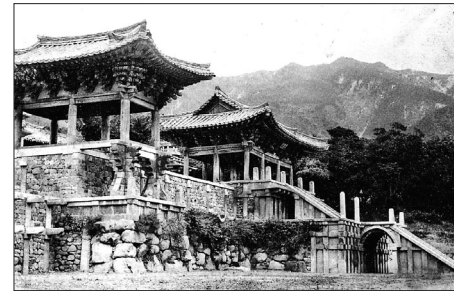
변경 전 불국사 석원급 계단 실측도(사진 왼쪽)와 일제시대 불국사 청운교, 백운교 전경(사진 오른쪽). 불국사의 본래 모습을 알 수 있는 중요한 자료다.

통 관유지 일람도 등 건축도면 원본 총 10점도 최초로 일반에 공개됐다. 포럼에서는 전봉희 서울대 건축학과 교수의 '근대 건축도면 아카이브 현황과 국가기록원 소장자료의 의미' 기조발표를 시작으로 이규철 동경대 연구원의 '근대적인 측량기술의 도입과 건축도면의 제작', 주상훈 건축문화유산연구원 연구원의 '국가기록원 소장 건축도면을 통해 본 1910년대 관립시설' 등이 발표됐다.