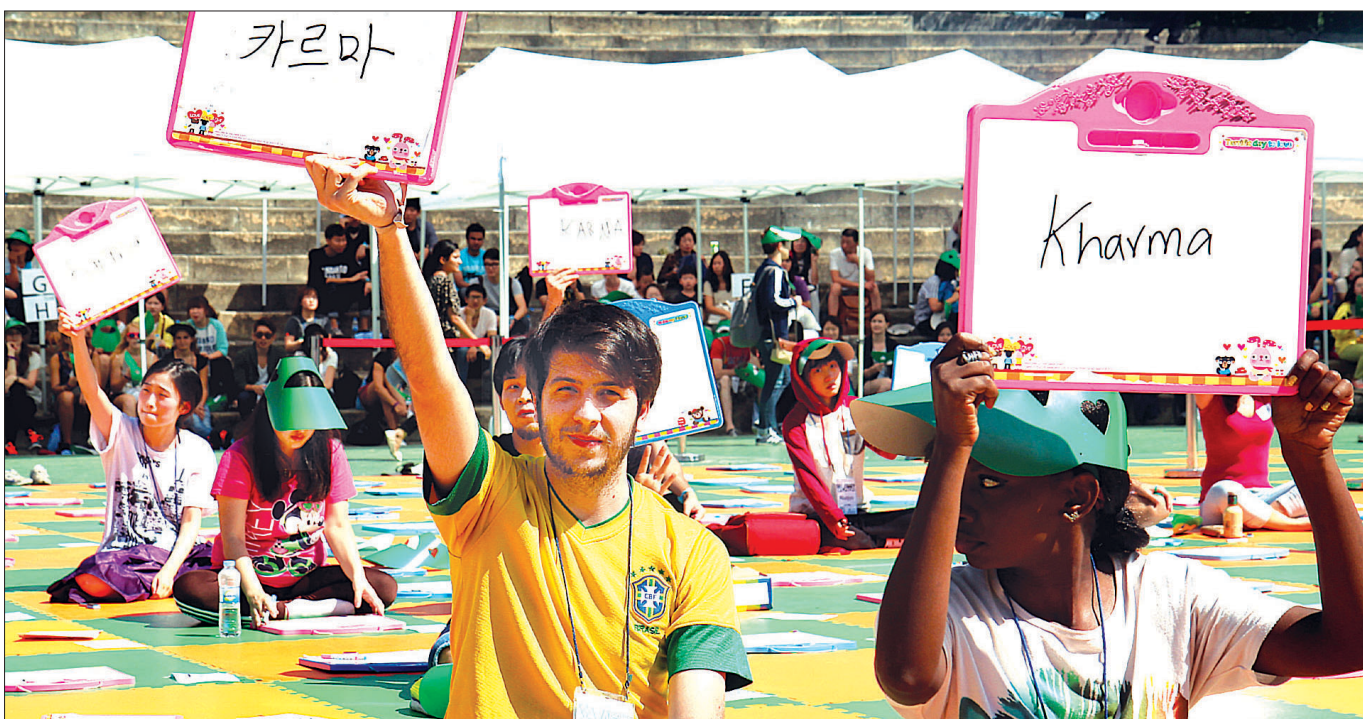
나란다 축제가 9월 20일 동국대서 열렸다. 이날 행사에서는 세대와 국경을 초월한 3000여 대중에게 자정면 공양을 제공해 눈길을 끌었다.