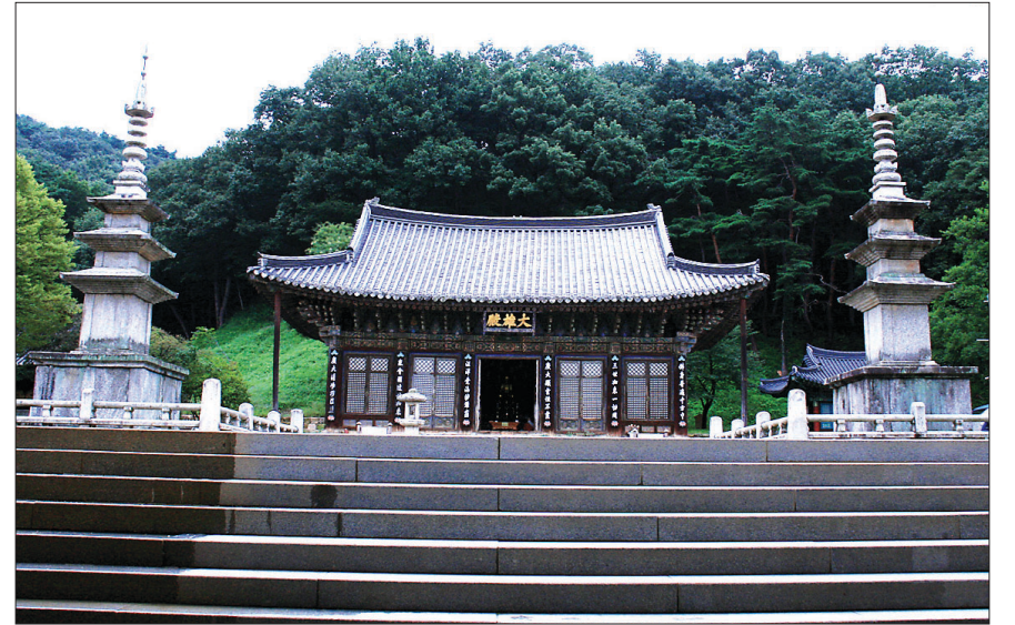
직지사 대웅전(경북유형문화재 제215호)과 삼층석탑(보물 제606호)

指寺)를 중수(重修)하려고 노인(老人)에게 서신을 보내와서 연화문(緣化文)을 요구하다 라는 긴 글이 적혀 있다. 목은이 이 시를 쓰게 된 배경이다.