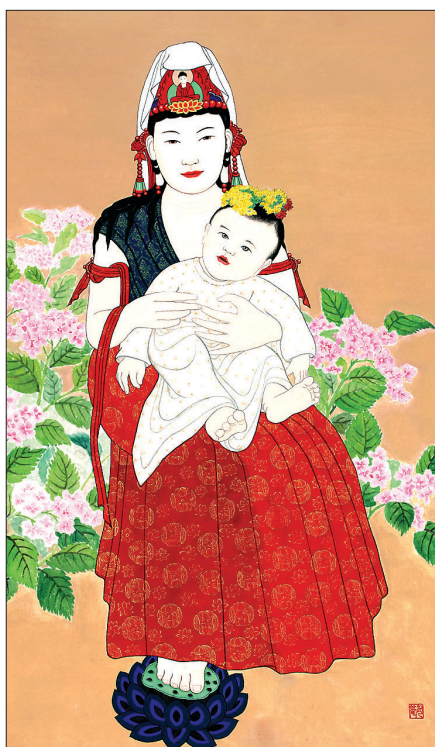
피에타를 떠올리며 완성한 ‘모자관음’

2010년부터 서울 법련사에서 출발 전국 33개 사찰 순회전 마쳐 ‘모자관음’, 현대화된 모습으로 표현 10월 19일 동해 삼화사에서 전시