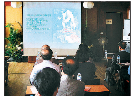
붓다석가모니 교계 시사회 장면

남 원장은 “재가단체에서 이만큼의 성과를 만들어낸 것은 상당히 고무적인 일이며, 불교를 영상으로 스터디할 수 있는 새로운