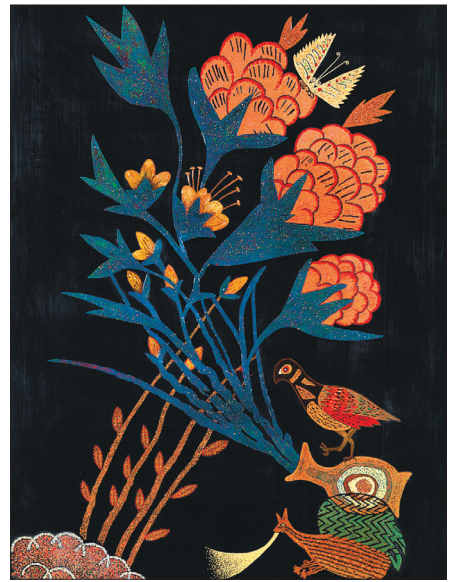
‘혼성도’ 평 · 달팽이를 재밌게 표현했다.

술 세계를 표현해왔다. 각각 다른 장르처럼 보이지만 이는 유기적으로 엮여서 그 빛을 발하고 있다. 스님의 예술은 분류가 없는 탈장르를 표방한다. “수행자로서 예술혼을 불태우는 그 자체가 곧 구도요, 수행입니다. 그것은 곧 불교사상과 우리문화의 전통을 뿌리에 두고 있기 때문이죠. 그래서 전