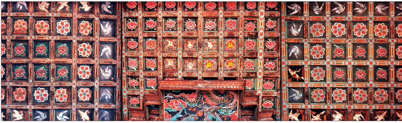
극락전 좌우협칸과 어칸 중앙에 경영한 천정장엄. 중앙을 더 높이 경영한 2층 평행층급 우물천정이다. 선학, 모란, 연화, 범자문이 심층적으로 전개되는 층층의 구조다.