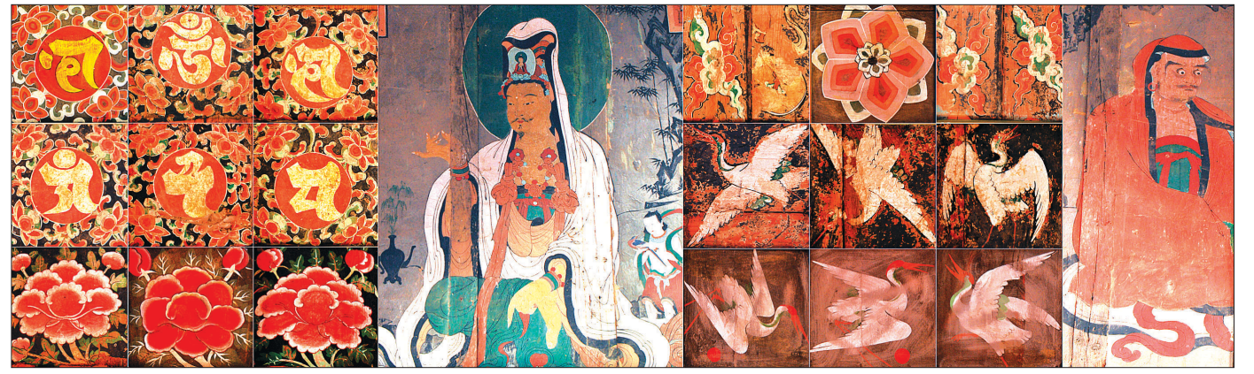
맨 왼쪽 범자문은 천정중앙에 배운 8자 준제진언이고, 달마와 백의수월관을 벽화는 동서 벽면에 그려진 것이다. 벽화 사이의 사진은 악기와 구름 영기문, 선학 문양이다.

3x3칸 건물에 경영되는 두 양식 일반적으로 불전의 천정구조는 기둥 축선으로 구획된다. 3x3칸 건물의 천정 역시 기둥 축선을 따라 구획되어 자연스레 우물(井)자 형식의 아홉 개 영역으로 나누어진다. 좌우의 한가운데 중앙은 내진주(內陣柱) 영역이고, 그 밖은 외진주(外陣柱) 영역이다. 3x3칸의 정방형 건물에서 경영되는 주요불전의 천정양식은 대개 두 가지 형태로 나타난다. 2층의 평행층급 우물천정 양식이거나, 혹은 외진주는 빗반자, 내진주는 평행 우물천정을 갖춘 일종의 궁륭형 양식이다.