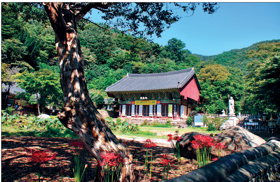
대원사 극락전 전경.

“음 자레 주레 준제 사바하” 대비신주 준제진언은 준제관음보살의 위신력으로 모든 죄업과 고(苦)를 멸하고 일체공덕을 성취하게 하는 진언이다. 갈항사지 3층석탑에서 나온 8세기 중엽의 진언다라니가 준제진언이다. 준제관음은 대자대비 관세음보살의 변화신 중의 한 분으로 모든 부처의 어머니인 불모(佛母)이다.