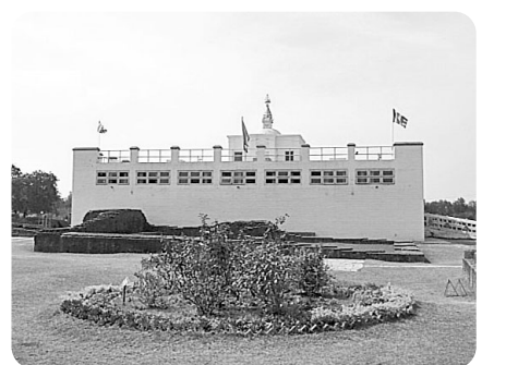
▲룸비니동산에서 부처님이 태어나신 곳