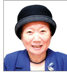
친구 모친 보며 어머니상 그려 '말 한 마디로 천 냥 빚 갚는다'

텔레비전에 비친 그분의 모습을 보고 어림잡아 지어달라고 옷을 만드는 이에게 부탁했으니 웬만하면 맞았을 것이다.