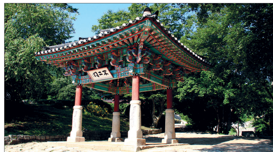
한국 전쟁 때 건봉사는 대부분 폐허가 되었지만 불이만은 유일하게 화를 면했다.

허균이 건봉사에서 지은 시에서 시적 반전이자 허균 자신의 삶을 반추하게 하는 대목은 “어찌 마음 씻고 참선 배워 인간의 노병사를 마치지 않는가?”라는 부분이다. 허망한 명리를 따라 다니지 말고 불성을 찾아 자유로운 길을 가라는 건봉사 스님의 충고를 듣는 대목인 것이다.