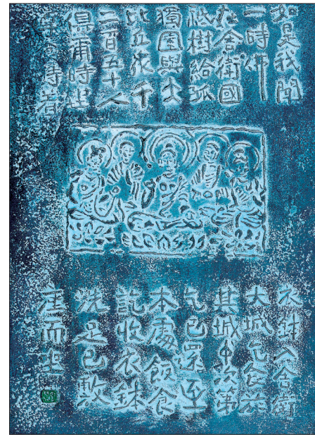
금강경 ‘법회인유분’ 분체로 고분의 느낌을 표현해냈다.

옥천사 앞에서 환하게 웃고 있는 스님 옆에는 깨진 향아리가 근사한 화분 조형물로 놓여 있다. 빨간색 돌을 스님이 화분으로 다시 만들어냈다고 한다. 상의 경계에서 자유로운 스님의 손길이 향아리에 새 삶을 부여해 낸 것이다. 이와 같이 스님의 작품은 늘 새롭게 태어나고 있었다. 그래서 스님의 자유로운 손길은 부처님의 뜻을 새겨 넣어 한 발 한 발 대중 가까스로 다가가고 있었다.