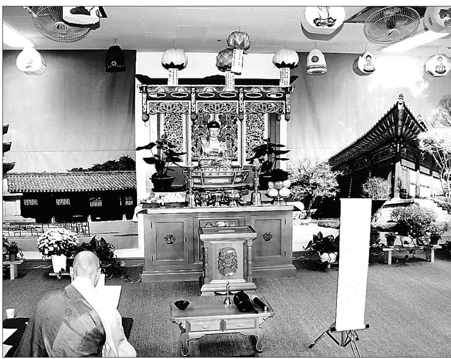
인천아시아게임 동안 운영되는 선수촌 내 불교법당. 매일 오전 9시부터 오후 8시까지 운영된다.

조계종 총무원 기획실장 일감 스님은 "역사문화보존구역은 전통사찰의 가치를 보호하자는 취지에서 만들어진 것"이라며 "주민의견을 반영하지만 아무래도 보존구역의 상한선이 축소되면 수행환경이 침해받고 사찰 주변이 난개발이 될 위험이 있다. 원래 입법취지에 맞게 현행대로 유지해야 한다"고 밝혔다. 조계종 문화부장 해일 스님도 "시행령 입법 추진 과정에서 전통사찰들과의 논의가 전혀 진행되지 않았다"며 "이번 시행령은 근본적으로 잘못된 것"이라고 강력히 비판했다. 한편, 문화부는 오는 9월 29일까지 이번 개정안에 대한 의견을 수렴해 시행령을 개정할 계획이다. 노덕현 기자