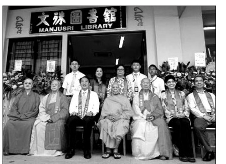
다시 문을 연 게이랑(Geylang) 불교도서관 오픈 기념식 사진. 이날 테오치헤안(Teo Chee Hean) 장관(사진 왼쪽에서 세 번째)이 참석, 이목을 집중시켰다.

기념식에서 "싱가포르는 인종과 종교의 조화를 위해 다양한 노력을 기울이고 있다"고 전제한 테오치헤안 장관은 "게이랑 불교도서관은 싱가포르 불자들의 심신의