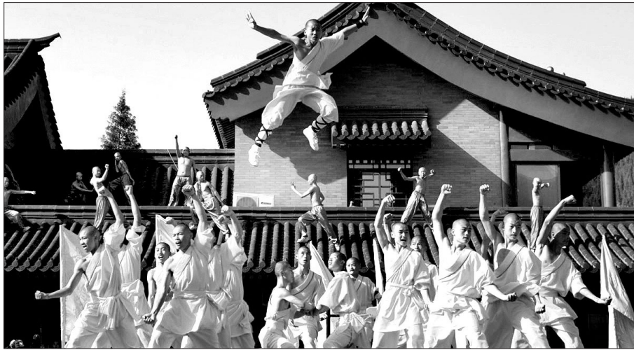
무술의 본산인 소림사가 무술학교 등 9개 계열사를 거느린 대기업으로 성장하면서 본분을 잊고 있다는 비판이 일고 있다.