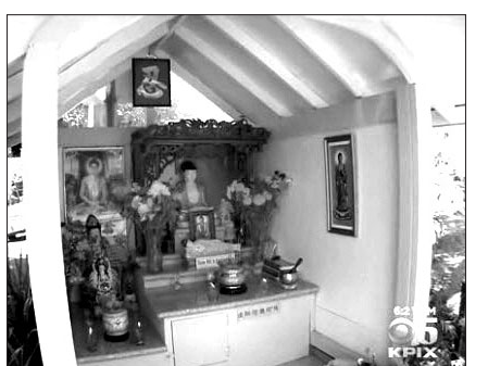
지난해 오를랜드 11번가에 세워진 '예불 공간' 전경.

이에 대해 "예불 공간이 힐링 공간이 되고 있는 것 같다"고 말한 모이로 씨는 "지난해와 비교해 약 15% 정도 범죄율이 낮